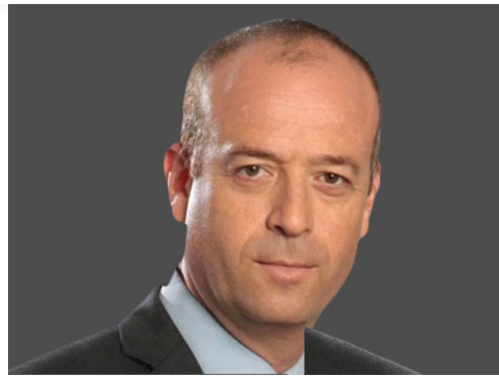
אבי גרובר ראש עיריית רמת-השרון

גרובר מודאג גם מהשפעות בריאותיות, ואומר: "בדיונים על מתקני השריפה אנשי משרד הבריאות הודיעו שהם אינם יודעים להעריך את הנזק הבריאותי שיגרם מהם. אנחנו לא ניתן לתושבי רמת השרון להיות שפני ניסיון", אומר גרובר. "מצד אחד עוצרים את המשק כולו בגלל סכנת קורונה ומצד שני בונים מתקנים שעלולים להוות סכנה בריאותית. במיקום הנוכחי הן נמצאות מאות מטרים מבתי מגורים, ברדיוס לא הגיוני. יהיו מפגעי ריח וגזים שיסכנו את בריאות התושבים".